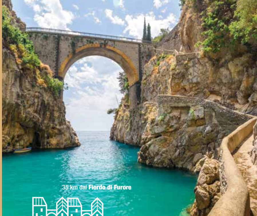
35 km dal Fiordo di Furore