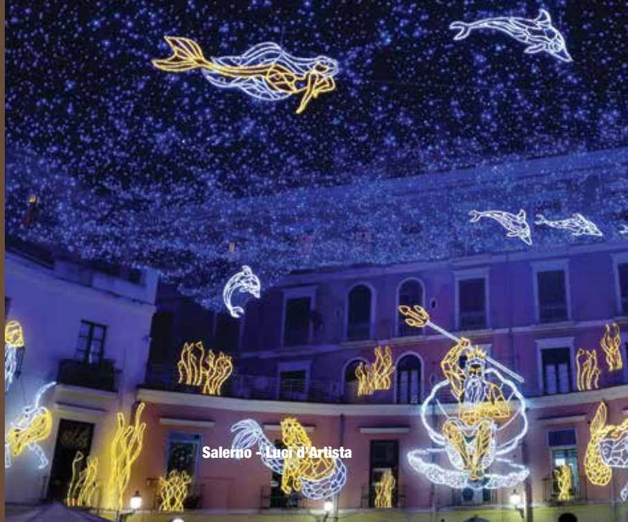
Salerno - Luci d'Artista