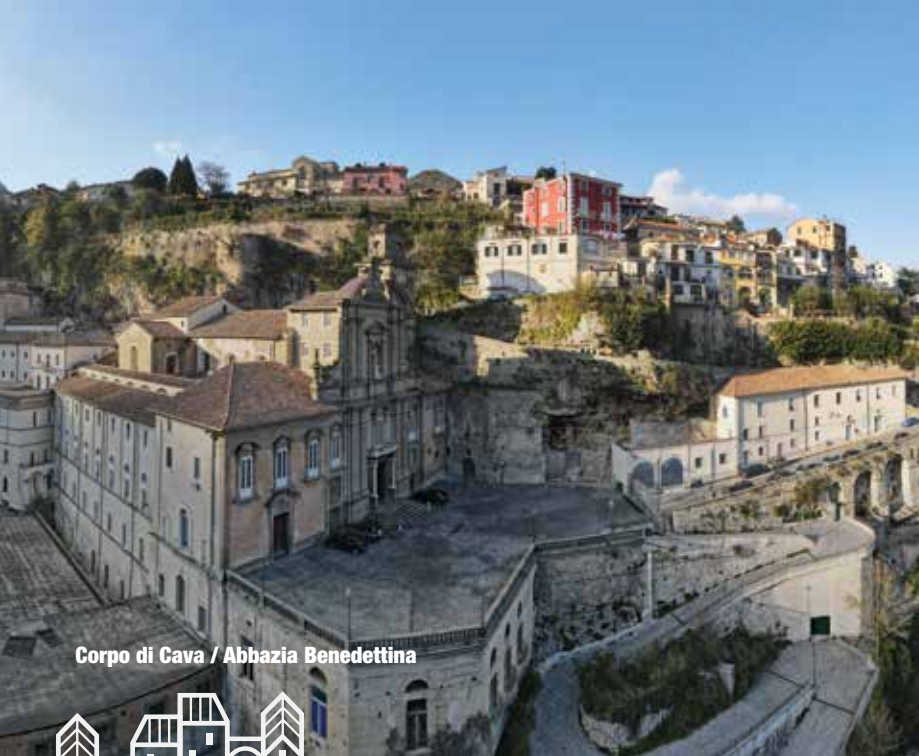
Corpo di Cava / Abbazia Benedettina