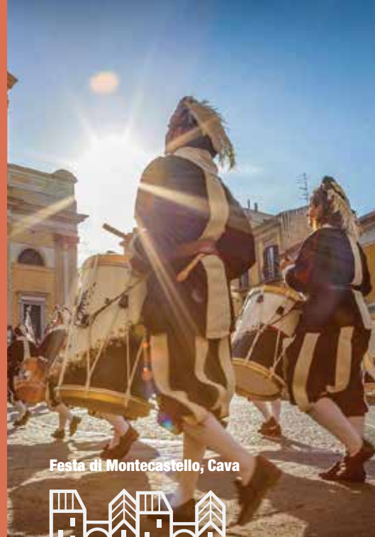
Festa di Montecastello, Cava