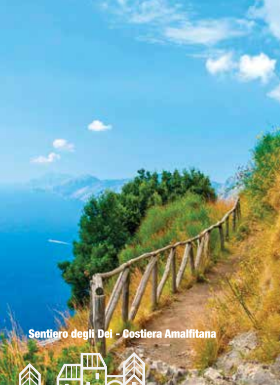
Sentiero degli Dei - Costiera Amalfitana