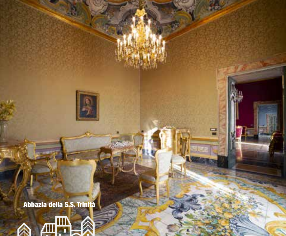
Abbazia della S.S. Trinità