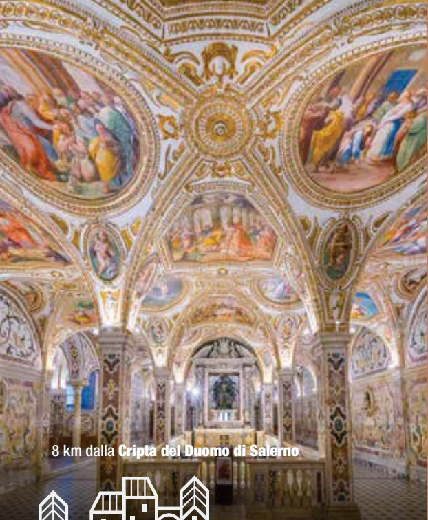
8 km dalla Cripta del Duomo di Salerno