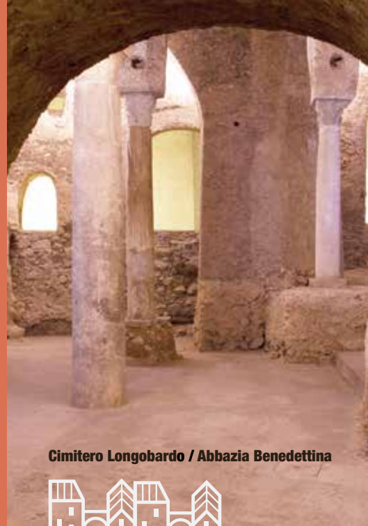
Cimitero Longobardo / Abbazia Benedettina